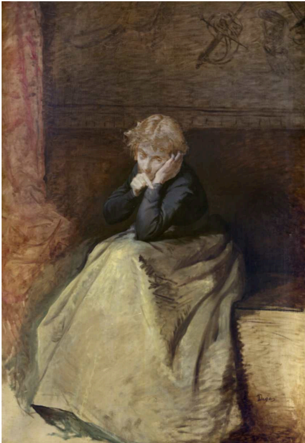
Edgar Degas, Jeune Italienne – Portrait présumé de la comtesse de Castiglione, huile sur toile, 153 × 105 cm, c. 1859.

de la signature avec celle d'autres œuvres, compte tenu du fait que Degas ne signait pas toujours de la même façon. Il s'est avéré que celle-ci s'identifie à d'autres déjà connues, parmi lesquelles la Vieille Italienne à laquelle l'artiste a ajouté « Rome 57 ». Des analyses scientifiques poussées, réalisées notamment par le laboratoire Emmebi Diagnostica de Rome et l'Université de Bologne , ont confirmé cette authentification.