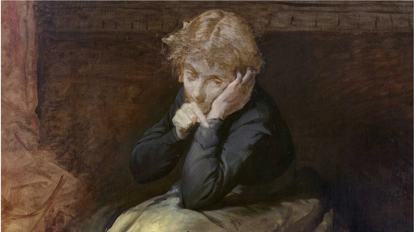
Edgar Degas, Jeune Italienne - Portrait présumé de la comtesse de Castiglione, huile sur toile, 153 × 105 cm, c. 1859.

L'énigmatique toile de grand format intitulée « Jeune italienne : Portrait présumé de la Comtesse de Castiglione », peinte en 1859, dévoile ses secrets sous l'expertise de Michel Schulman.