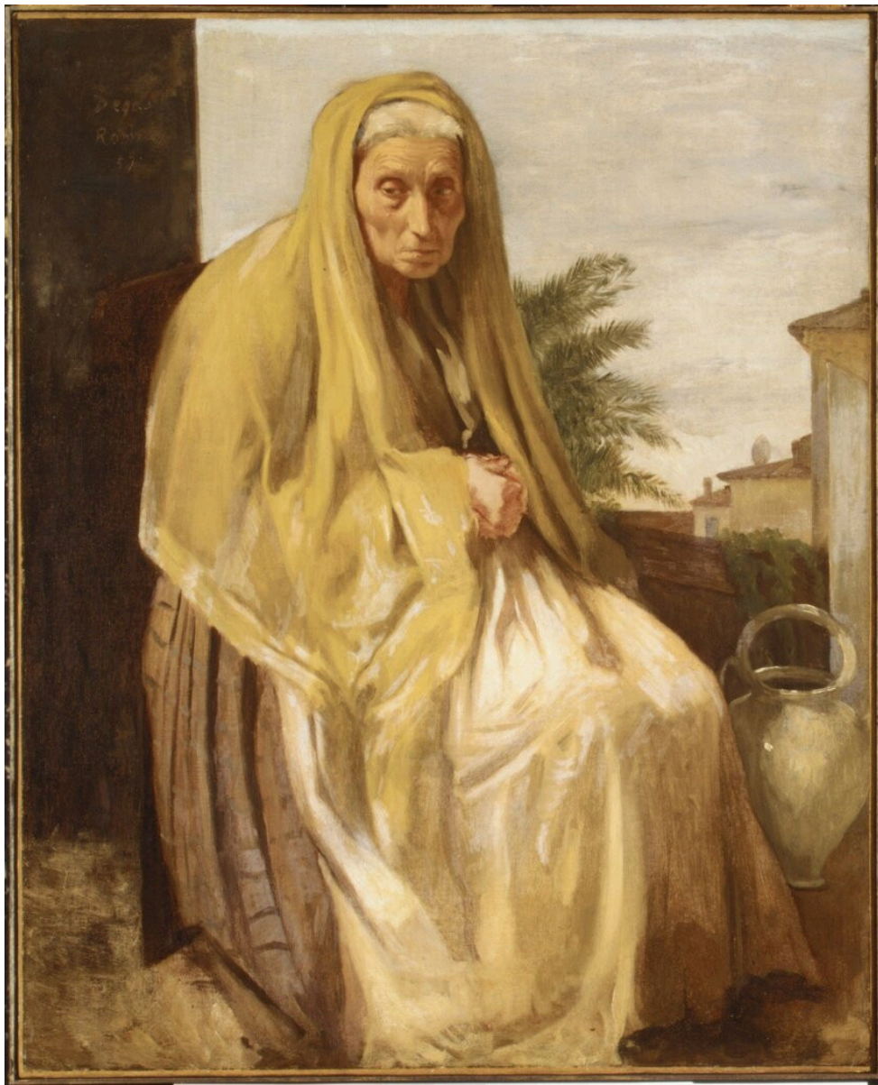
Edgar Degas, Vieille italienne , 1857, huile sur toile, 74 × 61 cm, Metropolitan Museum of Art, New York.

croisées symbolisent et soulignent la représentation d'un état d'âme tourmenté mais contenu, et le contexte historique conflictuel dans lequel s'inscrit ce portrait.