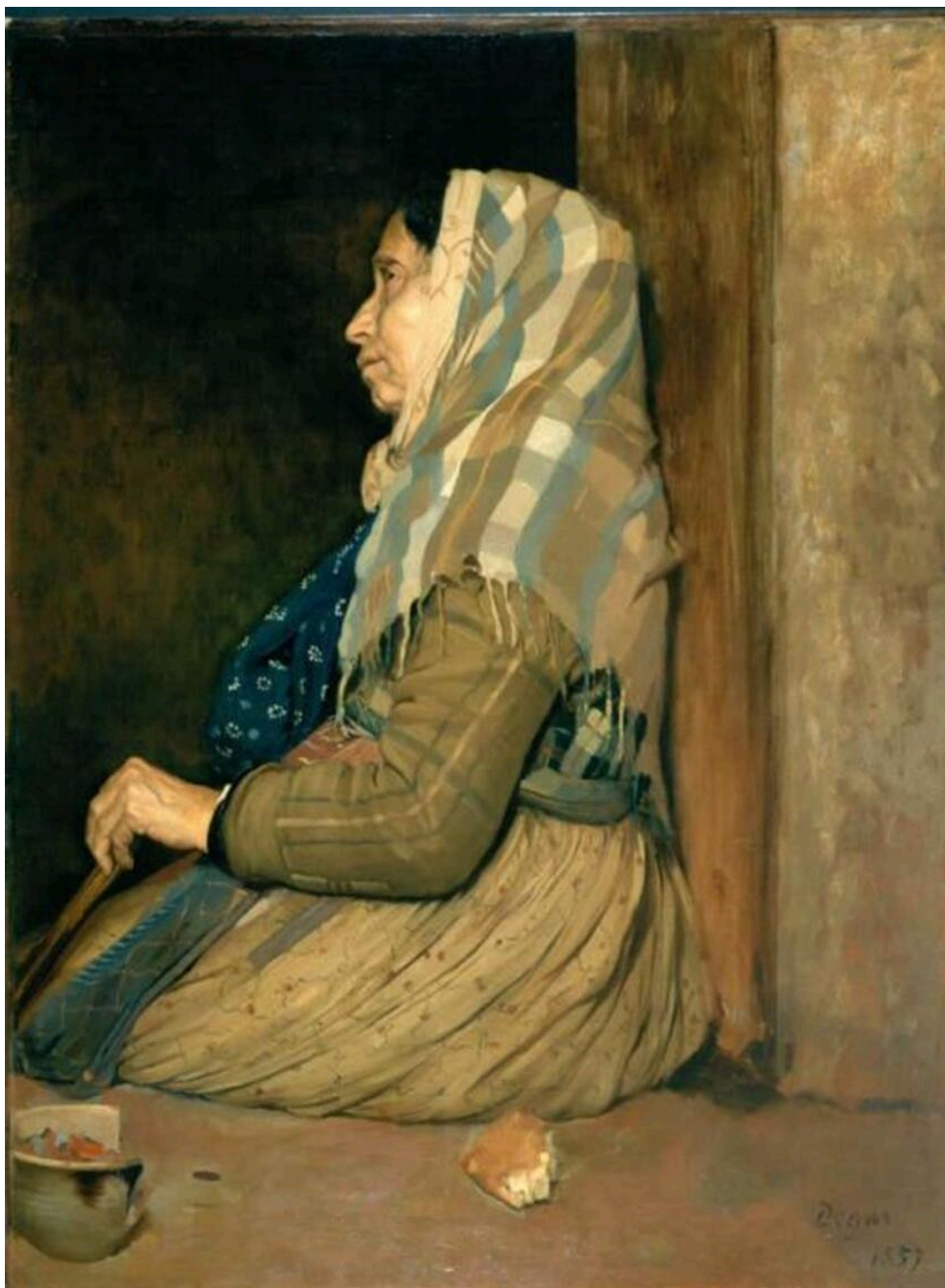
Edgar Degas, Mendiante romaine , 1857, huile sur toile, 100 × 75 cm,

Birmingham City Museum and Art Gallery , Birmingham