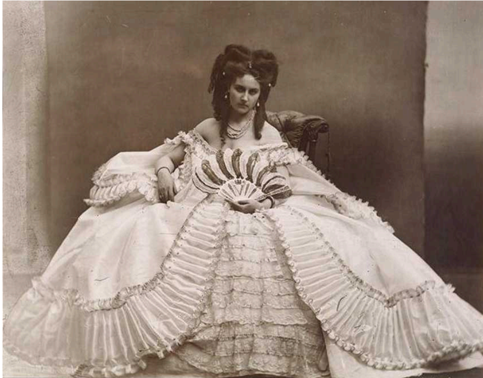
Pierre-Louis Pierson, La comtesse de Castiglione, dite à l'éventail, sous le titre de Elvira, 1863, collection du Metropolitan Museum of Art, New York.

réaliser l'ambition politique, ce fut pour elle un échec personnel, car ses compatriotes ont ignoré sa contribution, échec auquel s'ajoutait la déception amoureuse. Le portrait exécuté par Degas montre une femme pensive, en proie à une lutte intérieure et au bord de la dépression. Il est possible qu'ils se soient rencontrés lors du passage de l'artiste à Turin en 1859.